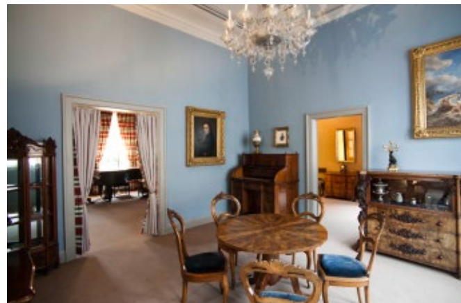
Liszt-Haus Marienstraße 17 | 99423 Weimar | Schließtag: Dienstag

Besuchen Sie im Anschluss das Wohnhaus Franz Liszts sowie die Dauerausstellung zu Leben und Wirken des berühmten ungarischen Musikers und Komponisten.