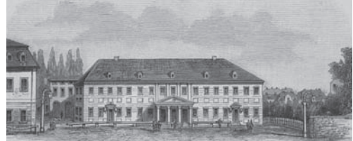
Das Weimarer Hoftheater, Ansicht 1800

Der heutige Theaterbau, 1908 eingeweiht, erhielt seinen Namen im Januar 1919 durch den damaligen Intendanten Ernst Hardt. Dieser moderne Künstler, Bürger und Demokrat wollte mit seiner Bühne der jungen deutschen Demokratie die Staatsbürger heranbilden, derer diese so nötig bedurfte. Auch für Hardt galt noch die Grundüberzeugung des Aufklärers Schiller, der auf die »ästhetische Erziehung« der Menschen setzte und fest glaubte, »dass es die Schönheit ist, durch die wir zur Freiheit wandern«.