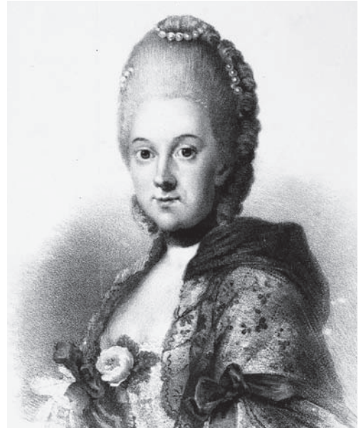
Herzogin Anna Amalia

Dass die »Weimarer Größen« insgesamt dominieren, unterstreicht erneut die Bedeutung des Musenhofes und den Rang seiner bürgerlichen und aristokratischen Protagonisten im kulturellen Gedächtnis nicht nur des damaligen Herzogtums, sondern alsbald auch ganz Deutschlands.