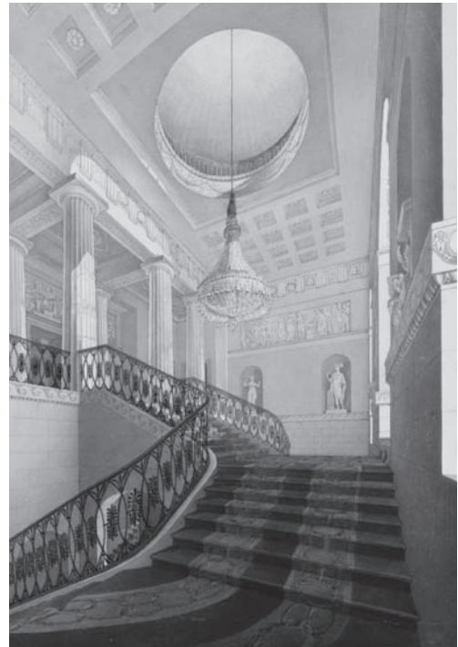
Gentsches Treppenhaus, um 1830

Die repräsentative Treppenanlage ist im Kern ein von Gentz im Dialog mit Goethe und Carl August entworfenes Ensemble. Das Bildprogramm der beiden zentralen Wandfriese zeigt den Herzog als Musenführer (Musagetes ist ein Beiname Apolls) und die Herzogin als fürsorgliche Landesmutter in der mythologischen Gestalt der Demeter. Überlebensgroße Statuen von Athena, Dionysos, Artemis und Hermes bezeugen die Anwesenheit antiker Göttlichkeit bzw. der zeitgenössischen Antikenbegeisterung. Weiterhin fällt die Apotheose des Fürsten (also Carl Augusts) als Zeus über der Durchgangstür zum Empfangszimmer ins Auge. Ihm huldigen die Stände der Krieger, Bauern und Bürger, denen er im Gegenzug huldreiche Fürsorge angedeihen lässt. Dies antikisierende Bildprogramm feiert den guten Fürsten (ein Ideal der Aufklärung) als »Vater« eines wohl geordneten, gedeihenden und künstlerisch ambitionierten Gemeinwesens, als das sich Sachsen-Weimar-Eisenach selbst inszenierte – und in dem folglich ein gewaltsamer Umsturz der politischen Verhältnisse nicht von Nöten sei. Kein Wunder, dass man das Gentsche Treppenhaus als antirevolutionäres Architekturensemble interpretiert hat.