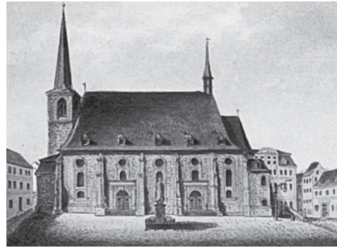
Stadtkirche St. Peter und Paul mit Herder-Denkmal, nach 1850

Nun also stehen sich der aufgeklärte Theoretiker toleranten Nationalbewusstseins und der radikale Vertreter eines aggressiven, rassistischen Nationalismus von Angesicht zu Angesicht gegenüber und symbolisieren damit das mögliche Spektrum des nationalen Bewusstseins auch noch unserer Tage.