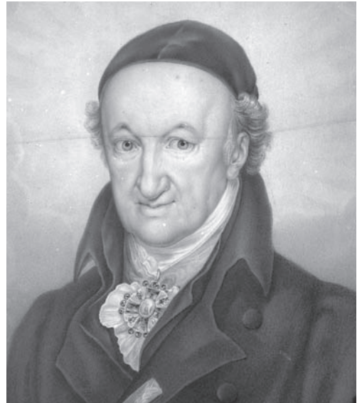
Christoph Martin Wieland