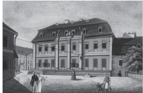
Wittumspalais, um 1840

Nachwirkungen der Aufklärung lassen sich auch an der weiteren Nutzung des Wittumspalais nach Anna Amalias Tod (1807) ablesen: Bis 1848 tagte hier die Freimaurerloge Anna Amalia , zwischen 1833 und 1848 der Landtag; ab 1848 residierte dort der Bildungsverein Lesemuseum mit seiner Bibliothek. Restauriert und umgestaltet zum Museum wurde das Haus erst 1870/71, als man im Kontext der Reichsgründung einen nationalen Erinnerungsort für den Weimarer Musenhof schaffen wollte. So treffen wir auch hier auf die weimartypische Mischung von authentischen Sachzeugen und späterer musealer Inszenierung.