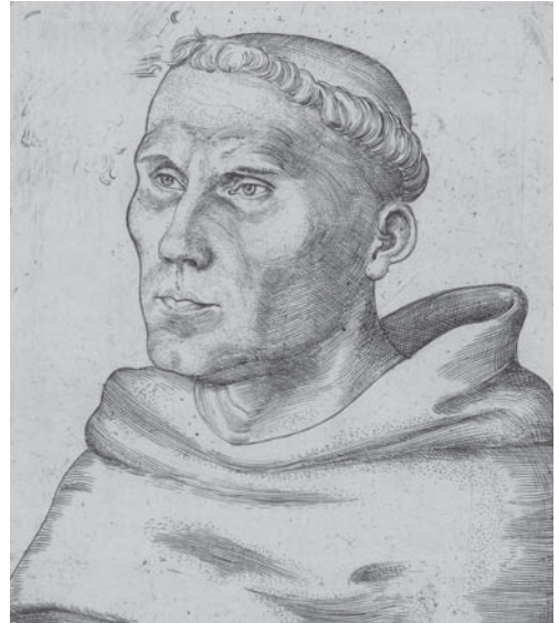
Luther als Mönch, 1520

Die national inspirierte Kulturgeschichtsschreibung des 19. Jahrhunderts zog eine klare Linie vom »Feuerkopf Luther« zum »Feuerkopf Schiller«, vom aufmüpfigen Geist der Reformation zur selbstkritischen Rationalität der Klassik. In der Innerlichkeitskultur des Protestantismus sah man – nicht ganz zu Unrecht – den Keim des Persönlichkeitsideals der Weimarer Klassik . Wittenberg – Wartburg – Weimar hieß die gloriose Trias deutscher Hochkultur und zahlreiche Texte populärer Reisebücher und -führer setzten die Stätten von Reformation und Klassik ständig in Beziehung. Luther und Goethe wurde damals zum Topos zahlreicher Festreden und nationaler Erbauungsschriften.