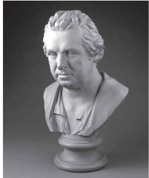
Johann Carl August Musäus, um 1784

So unterschiedlich im Einzelnen diese vier Persönlichkeiten auch waren – alle stehen mit ihrem Leben und Werk für die enge Beziehung zwischen deutscher Aufklärung und Weimarer Klassik . Sie markieren den Übergang und die wechselseitige Durchdringung beider Phasen der deutschen und europäischen Kulturgeschichte. Zudem einte sie bei aller Unterschiedlichkeit in Lebenslauf und Alter die Verehrung der Antike, deren Rezeption in Weimars »klassischer« Zeit ohne Böttiger, Musäus, Riemer und Voß nicht zu denken ist.