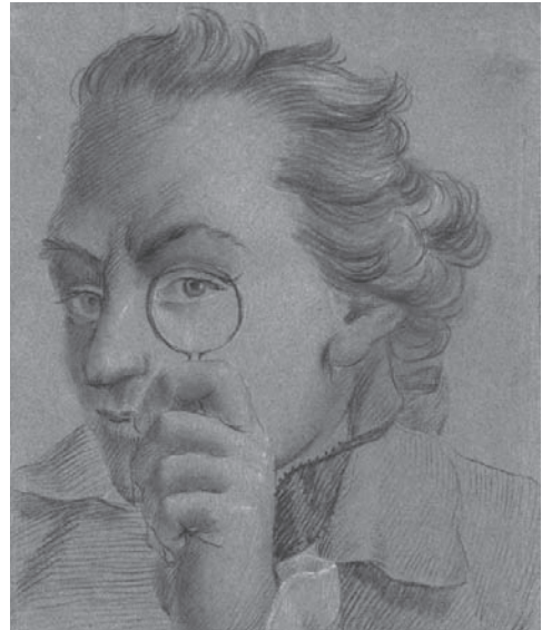
Georg Melchior Kraus

Dieser repräsentative Bau (nun Sitz der Hochschule für Musik FRANZ LISZT) steht dem Stadtschloss genau gegenüber; zwischen beiden liegt das Rote Schloss (heute Studienzentrum der Herzogin Anna Amalia Bibliothek). Es wurde 1574/76 als Wohnsitz der Witwe Herzog Johann Wilhelms, Dorothea Susanna (1544–1592), erbaut und erhielt 1820 durch den klassizistischen Baumeister Clemens Wenzeslaus Coudray seine eingeschossige Hofbegrenzung, vor der ein Brunnen mit einem Exemplar der berühmten Ildefonso-Gruppe steht. Das Fürstenhaus wurde ab 1770 auf Veranlassung Anna Amalias errichtet; nach dem Schlossbrand (1774) fungierte es als Hauptwohnsitz der fürstlichen Familie. Der Platz davor wurde 1945 in Platz der Demokratie umbenannt. Dies erinnert daran, dass im Fürstenhaus im 19. Jahrhundert der Landtag von Sachsen-Weimar-Eisenach, ab 1920 (bis zur Auflösung 1932) der des demokratischen Landes Thüringen getagt hat.