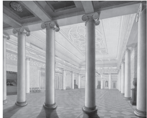
Festsaal, um 1830

So darf man den Festsaal als Verkörperung der »klassischen« Idee des »Weltbürgertums« interpretieren, die wiederum auf dem aufklärerischen Ideal vom »Kosmopolitismus« fußte, für das Wieland zeitlebens schrieb und stritt. Bei Goethe bedeutet »Weltbürgertum«, große Neugier für andere Kulturen zu besitzen und im Laufe des eigenen Lebens zu entwickeln – eine Haltung, die uns alles andere als veraltet zu sein scheint.