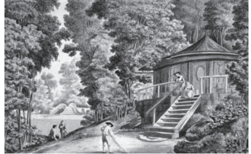
An der »Klause« am Ilmpark, 1788

Aus dieser Stätte heiterer Geselligkeit machte Carl August später wirklich eine Einsiedelei. Er schuf sich mit dem umgebauten Luisenkloster sowie dem ersten Borkenhäuschen von 1784 eine »Klause« als intimen Rückzugsort von seinen Repräsentations- und Regierungspflichten. So oft als möglich zog er sich hierhin zurück und gab sich der Muße und der Lektüre, vor allem aber der unmittelbaren Empfindung der Natur hin. So verwirklichte er zeitweise das rousseausche Ideal hof- und stadtabgewandten Lebens in der Natur, pflegte den Freundschaftsbund mit Goethe, dessen Gartenhaus gegenüber lag, und ließ sich durch beides zu weiteren gartenkünstlerischen und naturkundlichen Experimenten anregen.