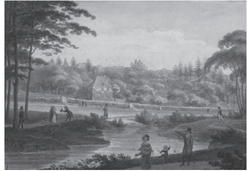
Blick auf Goethes Gartenhaus, 1826/27

Nicht zuletzt jedoch fand die in den ersten Weimarer Jahren besonders enge und herzliche Beziehung zwischen dem »Genie und seinem Fürsten« (Friedrich Sengle) im Gartenhaus ihren idealen Ort. »Wir saßen oft tief in die Nacht hinein, und es war nicht selten, dass wir nebeneinander auf meinem Sofa einschliefen«, erinnert sich der alte Goethe an die zahlreichen Treffen mit Carl August, bei denen man sich auch über Staatsgeschäfte und amtliche Angelegenheiten austauschen konnte. Für beide Männer war das Gartenhaus jedoch auch verknüpft mit erotischen Erfahrungen und Erinnerungen: War es zunächst Schauplatz der frühen Liebe Goethes zu Christiane Vulpius, so lebte zwischen 1810 und 1820 die Mätresse Carl Augusts, seine große Liebe Caroline Jagemann, dort mit ihren Kindern.