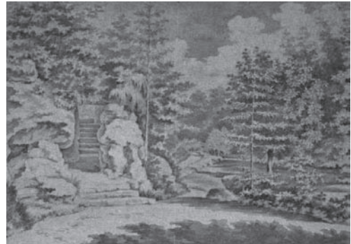
Felsentreppe, um 1778

Kontext und Anlass dieses ersten Schrittes zur Umgestaltung der Ilmauen in einen repräsentativen, doch zugleich anmutigen Landschaftspark verweisen auch auf die Rolle Goethes als Regisseur und Zeremonienmeister fürstlichen Amusements und höfischer Geselligkeit. In dieser Funktion kooperierte er zwangsläufig eng mit Carl August, Herzogin Luise und einzelnen Hofchargen.