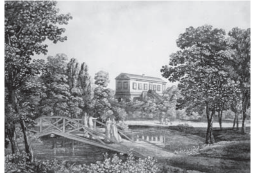
Blick auf das Römische Haus von der Wiesenbrücke, 1799

Eine klare Blickachse besteht zum Gartenhaus Goethes, wobei Carl August auf seinen höchsten Diener und Dichter herabschaute. Die optisch hergestellte Nähe könnte darüber hinwegtäuschen, dass sich Genie und Fürst gerade beim Bau des Römischen Hauses oftmals nicht einig waren.