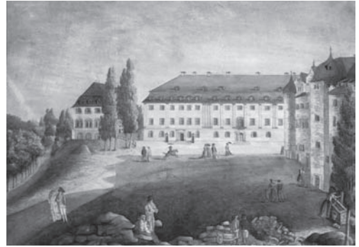
Fürstenhaus, um 1790

Im Fürstenhaus residierte in der Weimarer Republik der Thüringer Landtag; seit 1951 ist es das Hauptgebäude der Hochschule für Musik Franz Liszt.