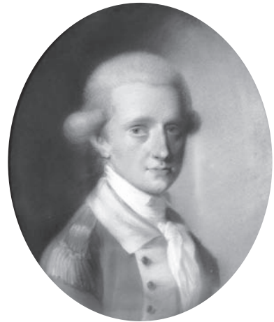
Carl August von Sachsen-Weimar-Eisenach, um 1775

Das von Kalbsche Haus, erstmals erwähnt 1429 als Deutschritherhaus , wurde 1809 vom herzoglichen Mundkoch François-René Le Goullon erworben und als Hôtel de Saxe geführt. Mit Ausbruch des deutsch-französischen Krieges 1870 verdeutschte man den Namen. Im Zweiten Weltkrieg schwer beschädigt, wurde Anfang der Fünfziger Jahre ein Teil des Gebäudes in der heutigen Form wieder aufgebaut.