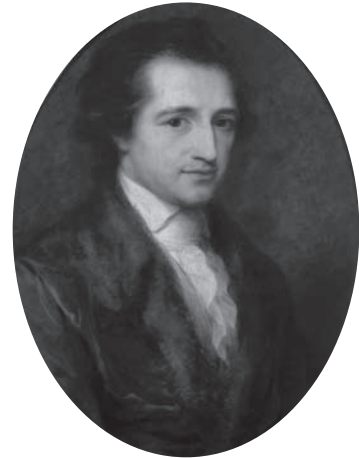
Johann Wolfgang von Goethe, 1787/88

Das Gebäude von Goethes erster eigener Stadtwohnung wurde um 1600 erbaut und zählte lange zu den größten Profanbauten der Stadt. Im Innern haben sich bis heute einige bemerkenswerte Ausstattungselemente erhalten, die einen Blick lohnen. Im Erdgeschoss ist eine kassettierte Holzdecke zu sehen (von 1604), im Obergeschoss finden sich Fensternischen mit eingestellten Pfeilern und Säulen. Doch mehrere Umbauten sowie ein Brand im Jahre 1834 haben das Meiste der originalen Architektur aus Renaissance und Barock längst verschwinden lassen.