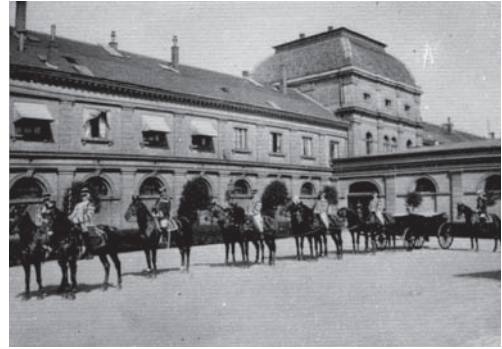
Galazug des Großherzogs Wilhelm Ernst, um 1915

Das Hauptstaatsarchiv (modernisiert 1995/2004) nutzt seine Bestände regelmäßig für thematische Sonderausstellungen und ist damit ein aktiver Teil des kulturellen Gedächtnisses in Weimar und Thüringen.