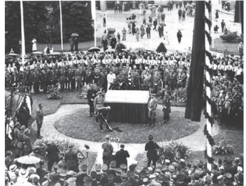
Gauleiter Sauckel und Hitler beim ersten Spatenstich zum späteren Gauforum, 4. Juli 1936

Eine umfassende Ausstellung zur Geschichte des Gesamtkomplexes ist im Anbau des unvollendeten Glockenturms zu besichtigen.