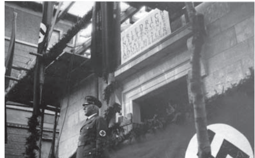
Der Architekt Paul Schultze-Naumburg bei der Weihe der Nietzsche-Gedächtnishalle, 30. Oktober 1937

Kurzzeitig als Sitz des Sowjetischen Geheimdienstes genutzt, diente der im Inneren um- und ausgebaute Komplex ab 1946 als Rundfunkstudio. Inzwischen in privater Hand steht das Gebäude seit nunmehr zehn Jahren leer.