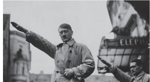
Hitler und sein Stellvertreter Rudolf Heß nehmen eine Parade ab, 12. Oktober 1930

Hitlers private Suite lag zur stillen Gartenseite hin. Nach der glanzvollen Einweihung im November 1938 aber wurde diese nur wenig genutzt, denn allzu oft kam der »Führer« nicht mehr in seine »Pfalz«. Die fotografisch dokumentierten Huldigungen tausender Weimarer Bürger (»Lieber Führer komm heraus aus dem Elephantenhaus «) und zahlreicher NS-Formationen fanden daher wohl überwiegend vor dem Umbau des Hotels statt.