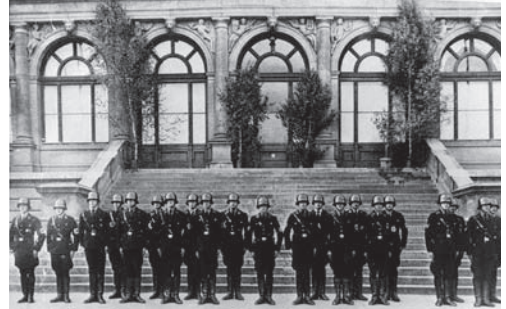
SS-Stabswache vor dem als Reichsstatthalterei genutzten Landesmuseum, 1934

Diese Ereignisse um Fricks berüchtigten Erlass Wider die Negerkultur für deutsches Volkstum waren Vorschein späterer Attacken gegen die moderne Kunst. Vom 23. März bis 24. April 1939 zeigte man im Landesmuseum die 1937 für München konzipierte Ausstellung Entartete Kunst . Kombiniert war diese »Schreckensschau« mit der Wanderausstellung Entartete Musik , die Weimars einflussreichster NS-Kulturfunktionär, Hans Severus Ziegler, schon 1938 für die Düsseldorfer Reichsmusiktage gestaltet hatte.