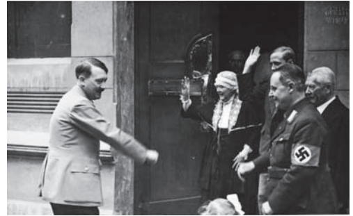
Elisabeth Förster-Nietzsche begrüßt Hitler im Eingang des Nietzsche-Archivs, 20. Juli 1934

Nach der Befreiung 1945 schloss das Archiv zwangsweise seine Pforten und wurde nie wieder eröffnet. Die Archivbestände kamen ins Goethe- und Schiller-Archiv. Das Gebäude ist heute Sitz des Kollegs Friedrich Nietzsche.