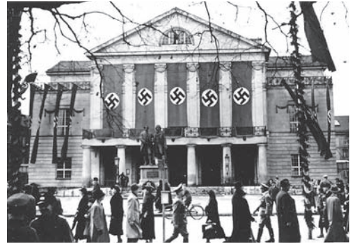
Das Deutsche Nationaltheater im Flaggenschmuck der Nationalsozialisten

Ende 1944 stellte das DNT den Spielbetrieb ein und wurde Rüstungsbetrieb. Bombenangriffe am 9. Februar 1945 zerstörten das Gebäude bis auf die Außenmauern. Die feierliche Wiedereröffnung mit einer Faust-Inszenierung fand am 28. August 1948 statt.