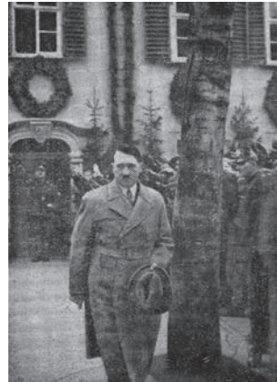
Hitler vor dem Schillerhaus, Nationalsozialistische Beamten-Zeitung, 25. November 1934

Weniger angenehm war dem Regime die Idee des Tyrannenmordes ( Wilhelm Tell ) und die Forderung nach Gedankenfreiheit ( Don Carlos ) – beide Dramen wurden 1941/44 verboten.