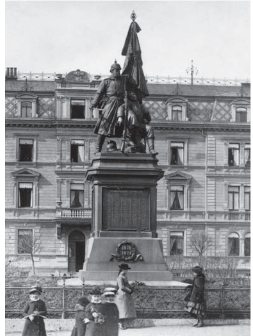
Denkmal für den Krieg 1870/71 auf dem damaligen Watzdorf-Platz, um 1900

Die Lage des Platzes im Stadtbild Weimars erinnert an den im Goethejahr 1949 geprägten Satz des Germanisten Richard Alewyn: » Zwischen uns und Weimar liegt Buchenwald, darum kommen wir nun einmal nicht herum. «