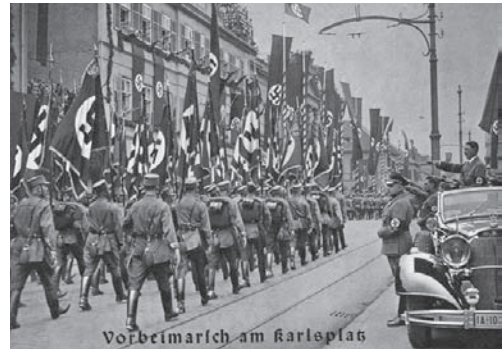
NS-Parade auf dem ehemaligen Karlsplatz, 6. November 1938

Die größten politischen Feierlichkeiten fanden hier vom 4. bis 6. November 1938 anlässlich des 10. Gautages Thüringen statt. Dazu hatte man das Reiterstandbild Großherzog Carl Alexanders (1907), von dem heute wieder der beschädigte Sockel zu sehen ist, eigens entfernt und auf den heutigen Buchenwaldplatz versetzt (siehe Station 1), um Platz für die Ehrentribüne des »Führers« zu schaffen.