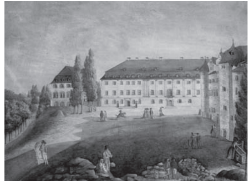
Fürstenhaus, um 1790

Der ehemalige Fürstenplatz, der Platz direkt vor dem Fürstenhaus, eingebettet zwischen Herzogin Anna Amalia Bibliothek und dem Roten Schloss, wurde somit nach 1774 eher unfreiwillig zum zentralen Schnittpunkt der politischen Macht im klassischen Weimar. Der Platz der Demokratie , wie der Fürstenplatz heute genannt wird, erinnert mit dem Reiterstandbild Carl Augusts (Enthüllung 1875) noch eindrucksvoll an jene Tage. Als Repräsentativbau der politischen Macht und des kulturellen Glanzes der Stadt Weimar gab er jedoch kein vorteilhaftes Licht ab. Diese Funktion sollte primär dem Stadtschloss vorbehalten bleiben. Die einfache Schlichtheit des Landschaftskassengebäudes war dafür nicht geeignet. Das Haus der Landstände sollte auch zukünftig bescheiden wirken. Immerhin hatten die Landstände keine große kulturelle Repräsentationsfunktion wahrzunehmen, sondern sollten sich um die Innenpolitik des kleinen Fürstentums kümmern.