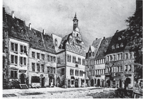
Das alte Rathaus

Was jedoch viel wichtiger erschien, war die Tatsache, dass mit dem Rathausneubau eine einheitliche Platzwand geschaffen wurde. Jetzt wirkte der Marktplatz nicht nur viel harmonischer, sondern die Fläche des Platzes wurde dadurch zugleich fast um die Hälfte vergrößert. Fortan, wenn auch erst in »nachklassischer Zeit«, konnte Weimar einen repräsentativen Marktplatz vorweisen, der den eigenen Ansprüchen und dem eigenen Selbstverständnis entsprach.