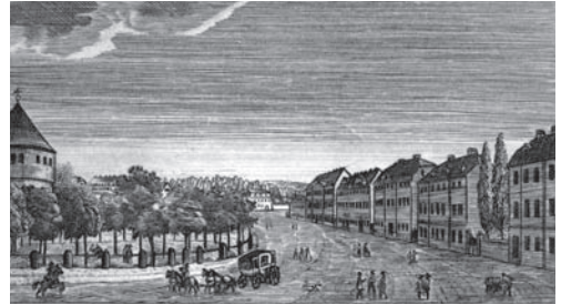
Carlsplatz, um 1850

Die endgültige, heute noch sichtbare Gestaltung des Carlsplatzes erfolgte allerdings nicht mehr in »klassischer« Zeit. Im Gegensatz zum Rathaus wurde das Areal auch in der Folgezeit im Stil des Klassizismus weiter umgestaltet. Vor allem das in Anlehnung an den Athener Niketempel 1859/60 errichtete Lesemuseum sowie die klassizistisch anmutenden Säulenkolonnaden sollten bewusst an das goldene Zeitalter Weimars erinnern.