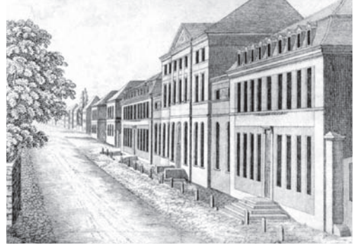
Front des Bertuchhauses, 1825

Ab 1780 ließ Bertuch sein Haus außen- und innenarchitektonisch im klassizistischen Stil umbauen. Durch weitere Anbauten wurde das Bertuchhaus schließlich zum größten Privatgebäude der Stadt Weimar. Bis 1803 entstand ein großzügiger Baukomplex, der in zwei Seiten- und einen Mitteltrakt gegliedert war. Die Länge der Fassade des Gesamtbaukomplexes betrug stolze 90 Meter. Das Bertuchhaus ist Ausdruck eines erfolgreichen und selbstbewussten Bürgers, der sich im »klassischen Weimar« der Außenwelt ähnlich prunkvoll-ästhetisch repräsentierte, wie dies etwa der Weimarer Hof mit seinem neuen Schloss tat.