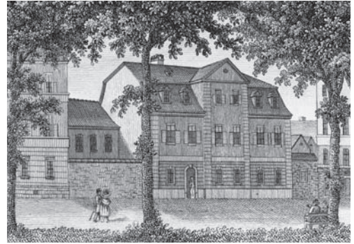
Schillerhaus an der Esplanade

Mit der Umgestaltung der Esplanade wurde einer der exklusivsten neuen Wohnbereiche der Stadt geschaffen. Viele der neu errichteten Häuser waren am Stil des Klassizismus ausgerichtet und sollten der beschworenen geistigen Größe Weimars gebührend Ausdruck verleihen. Dementsprechend teuer waren die Anschaffungskosten eines Hauses auf der Esplanade. So musste auch Schiller für sein Haus die stolze Summe von 4200 Reichstälern aufbringen.