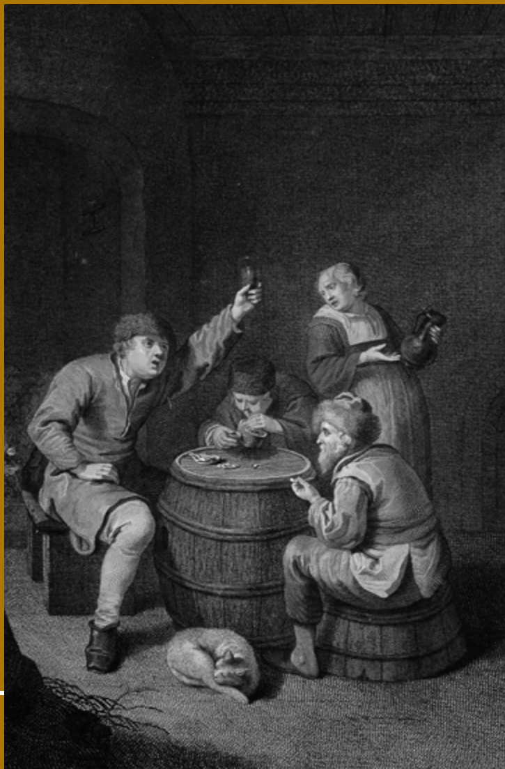
Bauern bei einem Fasse Peasants at a barrel