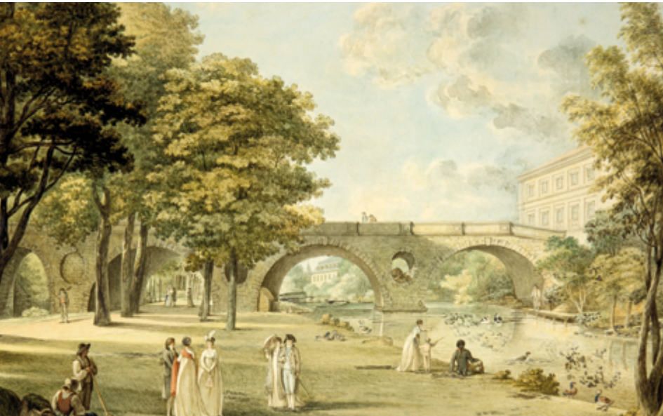
Sternbrücke mit Schlossfassade im Weimarer Park