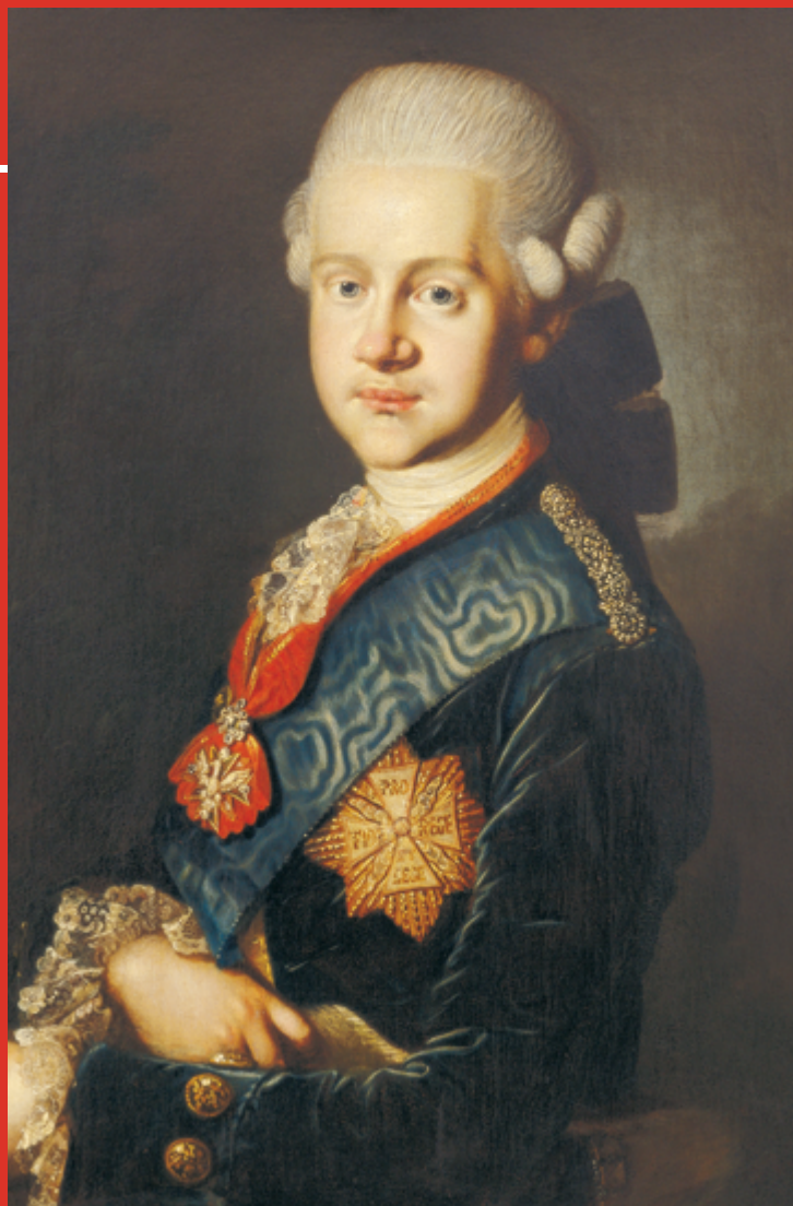
Herzog Carl August (1757-1828) Duke Carl August