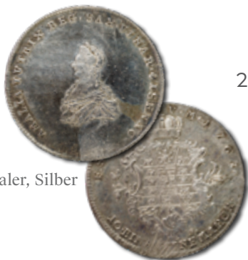
1 Taler, Silber