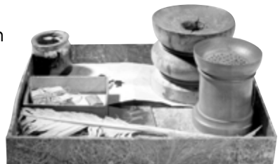
Tintenfass mit Federkiel