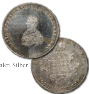
1 Taler, Silber