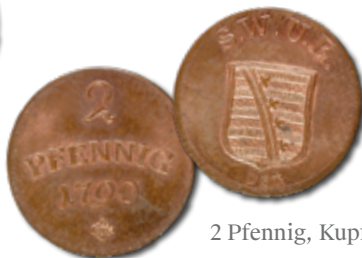
2 Pfennig, Kupfer