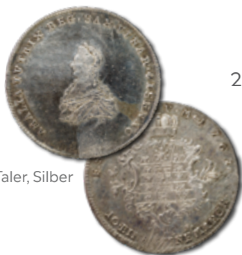
1 Taler, Silber