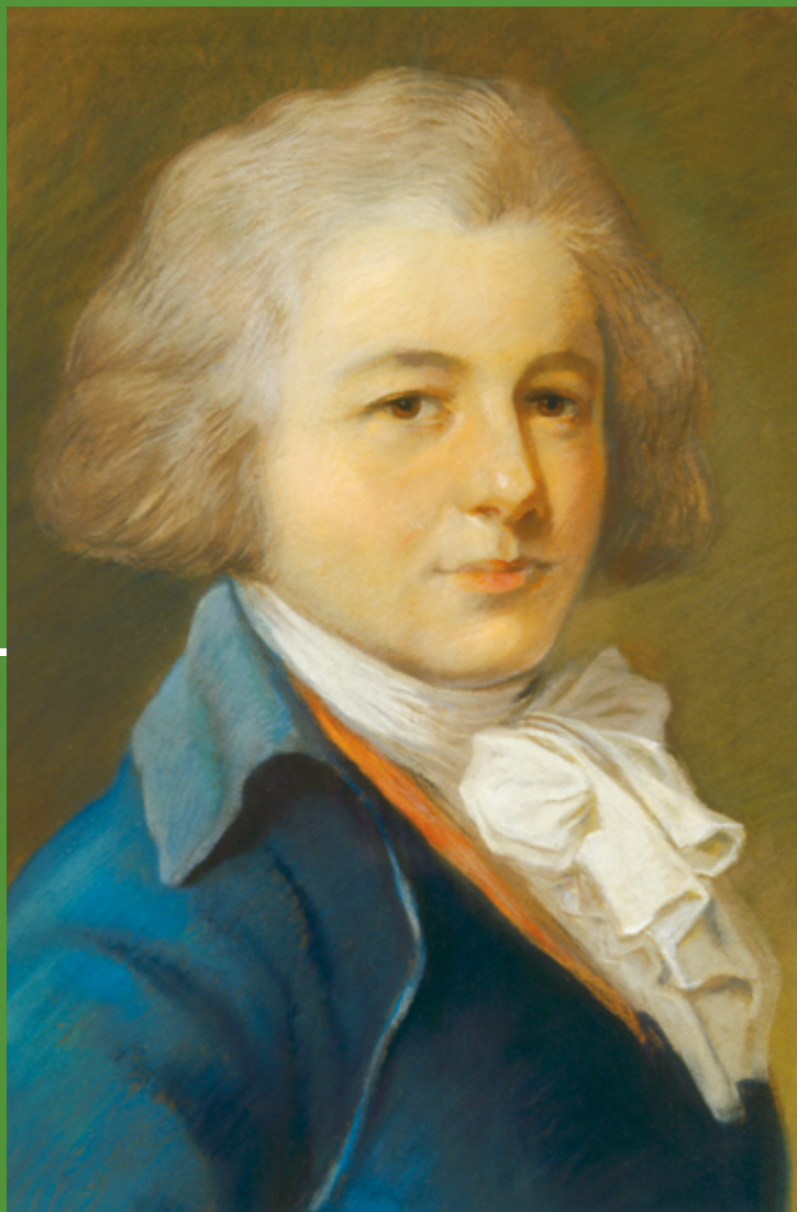
Friedrich Justin Bertuch (1747–1822)