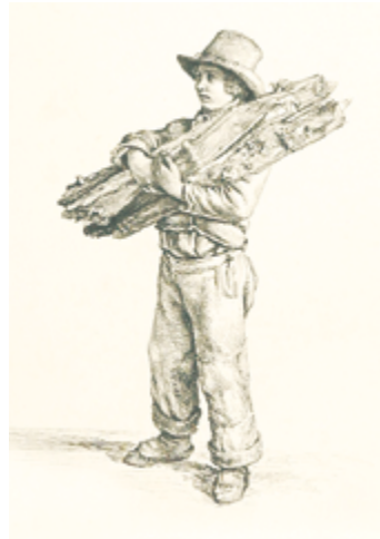
Bauernbursche mit Holzscheiten