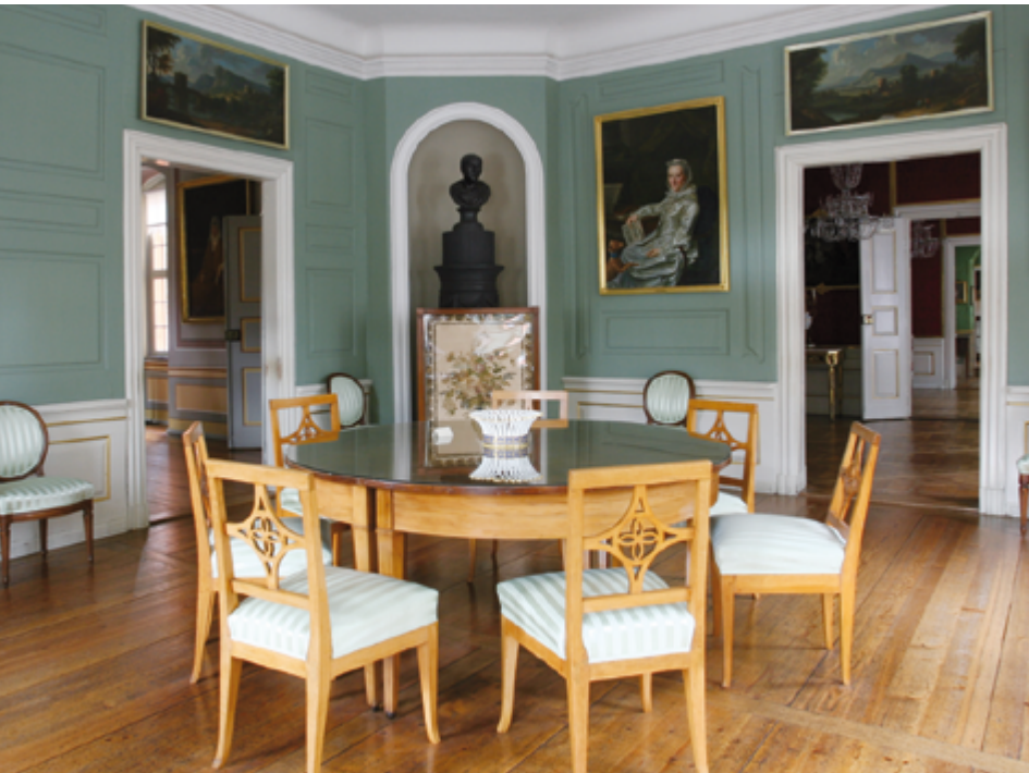
Tafelrundenzimmer im Wittumpalais