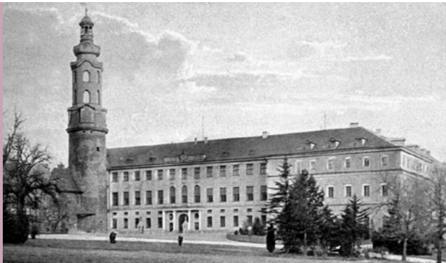
Südflügel des Stadtschlusses in Weimar