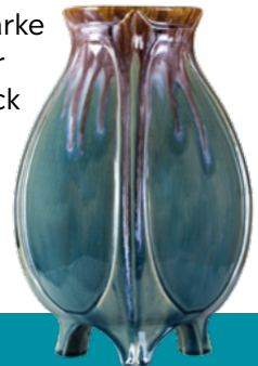
Henry van de Velde: Deckenleuchte, 1903/1904 und Vase, 1904