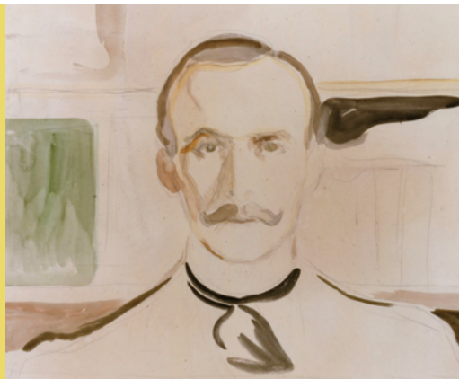
Edvard Munch: Portrait Harry Graf Kessler, gemalt um 1904