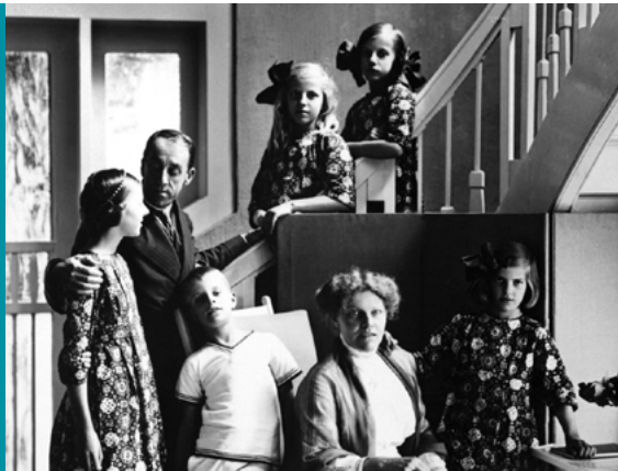
Van de Velde mit seiner Familie im Haus Hohe Pappeln, 1912