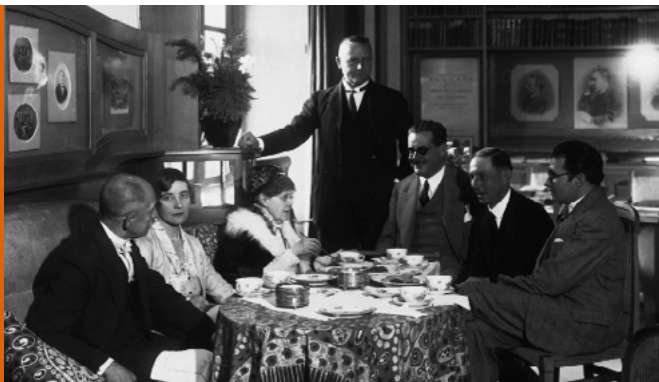
Elisabeth Förster-Nietzsche mit Gästen im Nietzsche-Archiv