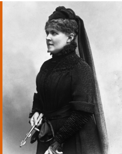
Elisabeth Förster-Nietzsche, 1900