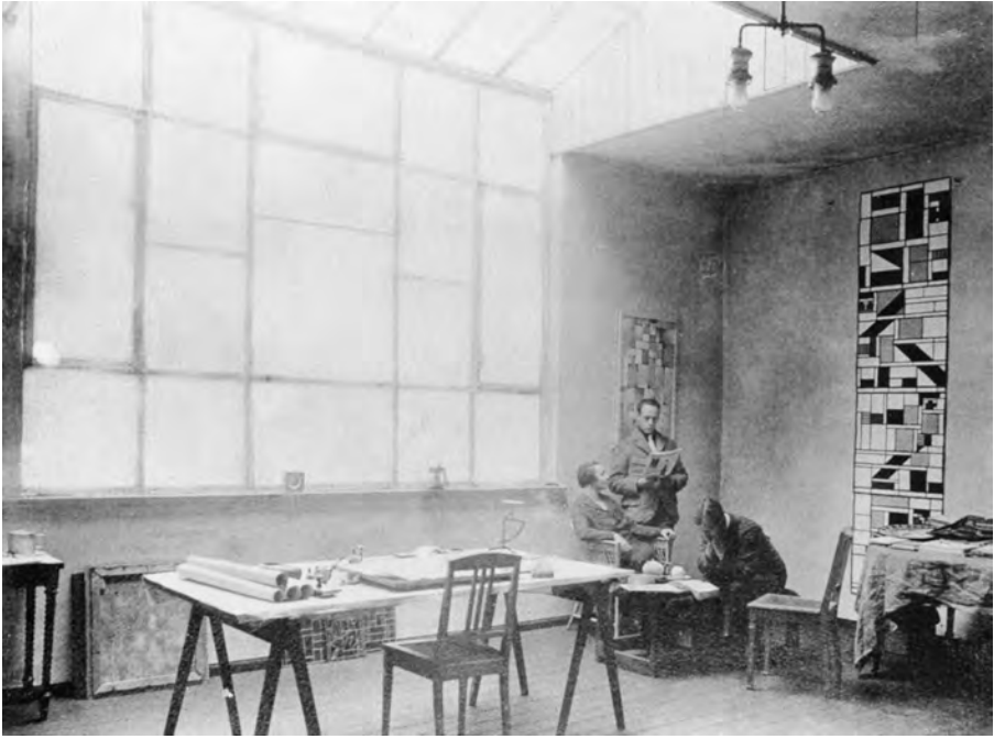
Abbildung 4 Atelier van Doesburgs in Weimar, 1922

unseren eigenen Ohren nicht trauen ließ. Nachdem er beschlossen hatte, das Gedicht sei zu Ende, tat er ganz sachlich den Karton in die Mappe zurück und trat mit einer kurzen, korrekten Verbeugung vor jeden von uns, mit Ausnahme derjenigen, die ihn schon kannten, und betonte auf streng hannoveranisch: Kurt Schwitters. 36