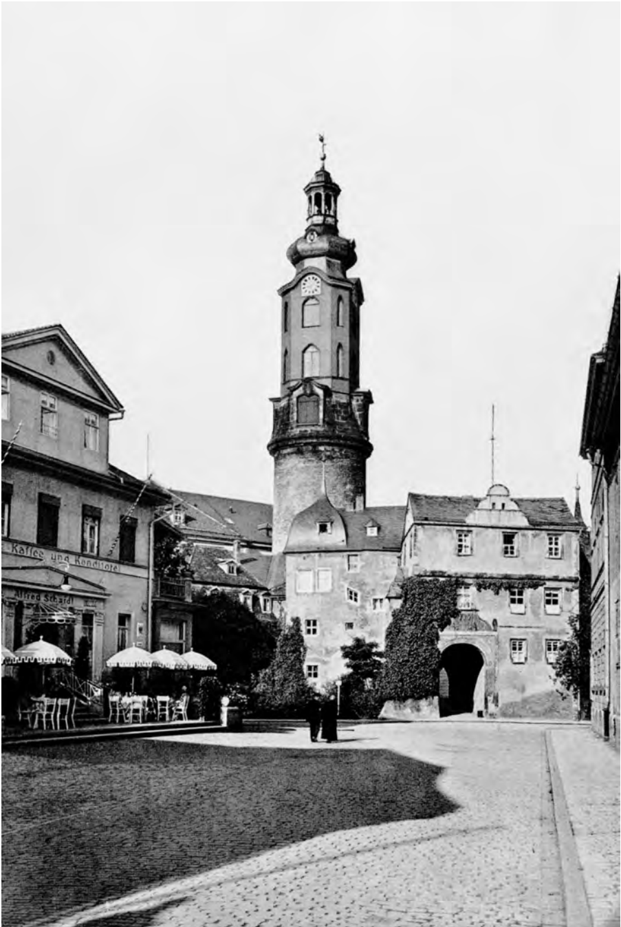
Abbildung 5 Residenz-Café Weimar, um 1925