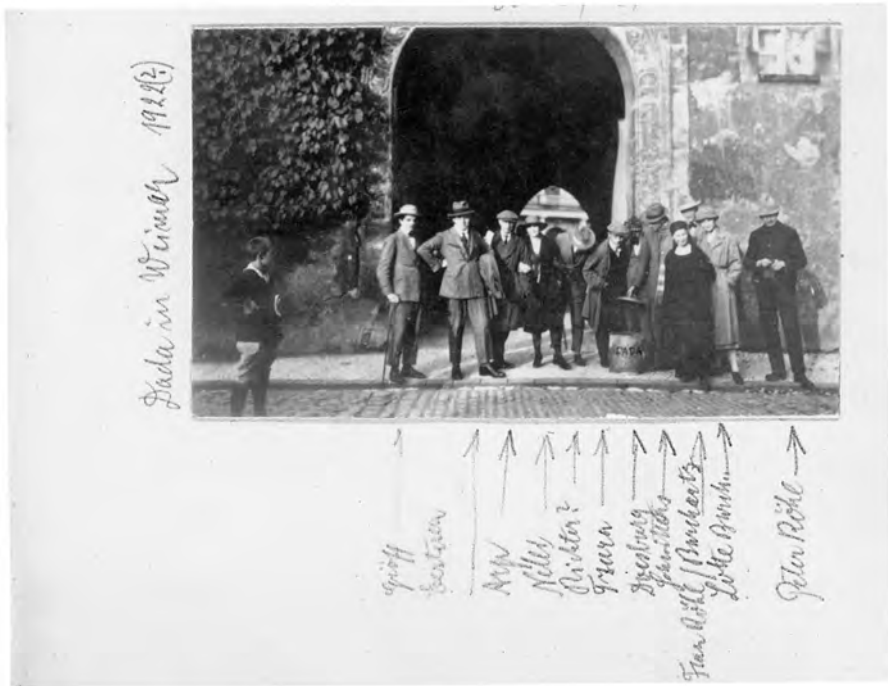
Abbildung 6 Die Kongressteilnehmer vor der Bastille des Weimarer Residenzschlosses; Fotografie mit handschriftlicher Benennung durch Kurt Schwitters