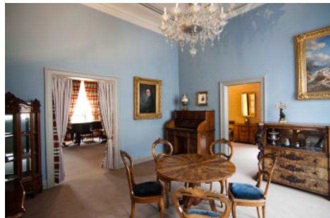
Liszt-Haus Marienstraße 17 | 99423 Weimar | Schließtag: Dienstag

Besuchen Sie im Anschluss das Wohnhaus Franz Liszts sowie die Dauerausstellung zu Leben und Wirken des berühmten ungarischen Musikers und Komponisten.