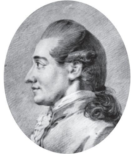
Der junge Goethe, 1776

Das Gedicht ist im September 1776 entstanden. Zu diesem Zeitpunkt lebte Goethe schon fast seit einem Jahr in Weimar; ein halbes Jahr zuvor, im April, hatte ihm Herzog Carl August (1757–1828) das Gartenhaus an der Ilm geschenkt. Nur als Besitzer von Grund und Boden konnte Goethe das Weimarer Bürgerrecht erhalten und Ministerämter übernehmen. Im Unterschied zum freien Schriftstellerleben in Frankfurt leistete Goethe also nun konzentrierte und zielgerichtete Arbeit. Die neuen Lebensverhältnisse des 27-Jährigen in der Provinz wurden vom Vater und den Freunden in Frankfurt kritisch beobachtet. Dass sich Weimar in den nächsten Jahren zu einem geistig-literarischen Zentrum Deutschlands entwickeln sollte, konnte zu diesem Zeitpunkt noch keiner ahnen.