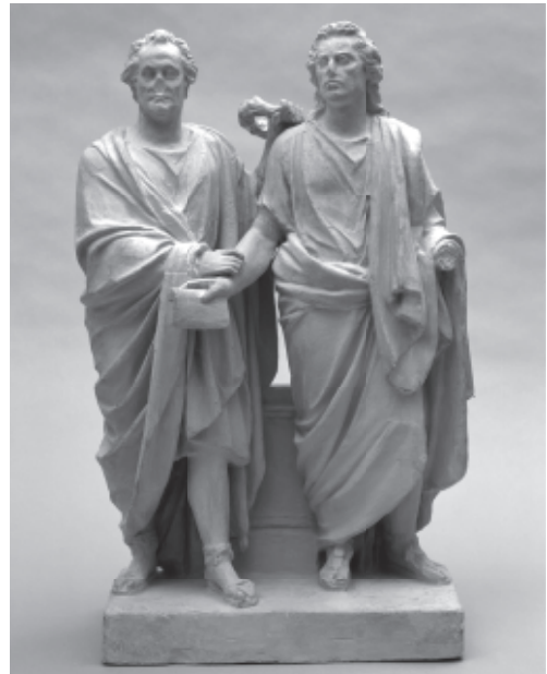
Entwurf des Denkmals von Christian Daniel Rauch, 1849

Bildlich findet die Freundschaft der beiden Dichter ihren Niederschlag in dem Denkmal auf dem Theaterplatz. Den ersten Entwurf lieferte der Bildhauer Christian Daniel Rauch, der den Auftrag jedoch an seinen Schüler Ernst Rietschel weitergab. Enthüllt wurde das Doppelbildnis am 4. September 1857 zu Ehren des 100. Geburtstags Carl Augusts. Bemerkenswert ist der Versuch, die Dichter einander gleichzustellen, bis hin zur Körpergröße – eigentlich war Goethe entschieden kleiner als sein Dichterfreund.