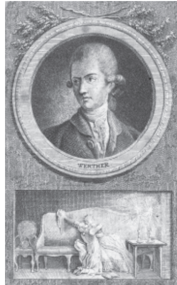
Illustration zum Werther, 1778

Unser Weg führt uns weiter am sog. Schlangenstein vorbei zur Schillerbank, von der aus wir auf die Ilm und auf Goethes Gartenhaus blicken können.