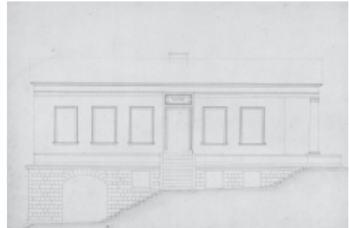
Aufrisszeichnung des Römischen Hauses, 1792

Auch das Römische Haus steht in antiker Tradition; es zitiert mit dem von gedrungenen dorischen Säulen getragenen Unterbau und dem von schlankeren ionischen Säulen gestützten Vorbau Stilelemente der griechischen und römischen Architektur. Es entstand in den Jahren 1792–1797 sowohl als repräsentatives wie auch als privates Gartenhaus für den Herzog und gilt als eines der ersten klassizistischen Bauwerke Deutschlands. Der Architekt Johann August Arens leitete den Bau in engem Austausch mit Goethe, sodass das Gebäude auch als ein Werk des Dichters gelten kann.