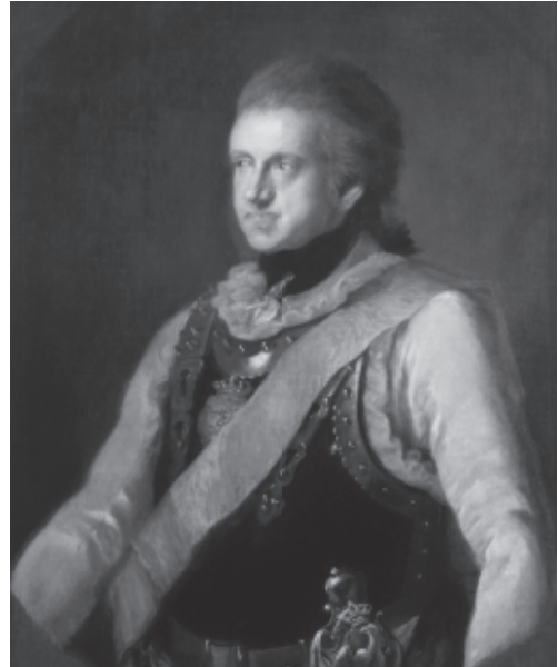
Herzog Carl August, um 1790

Vielleicht ist es nicht sofort offensichtlich, doch hier auf der Duxbrücke befinden Sie sich inmitten eines gemeinsamen Werkes der beiden Freunde. Carl August und Goethe gestalteten in enger Zusammenarbeit den Park als Landschaftsgarten. Ab 1778 ließen sie Wege ebnen, Bäume pflanzen und ganz im Sinne der englischen Landschaftsgestalter künstliche Ruinen, Grotten und Skulpturen errichten. Goethe wandte sich zwar später von der Theorie der Gartengestaltung ab, doch mit dem Bau des Römischen Hauses nahm er auch in den 1790er Jahren noch Einfluss auf das Erscheinungsbild des Parks. Die gesamte Anlage macht die Freundschaft zum Herzog sichtbar: Die Duxbrücke liegt mitten auf einer Blickachse, die Goethes Gartenhaus und Carl Augusts Römisches Haus miteinander verbindet.