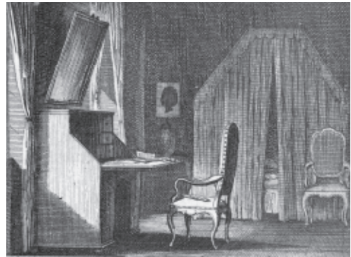
Illustration von Werthers Sterbezimmer, 1776

Im Umkreis der Fürstengruft sind auch wir vielbeweinten Schatten nahe: Das von Clemens Wenzeslaus Coudray errichtete klassizistische Gebäude birgt die Gebeine des Herzogs Carl August und seiner Familie sowie die sterblichen Überreste Johann Wolfgang von Goethes selbst.