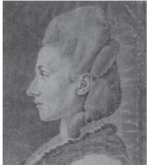
Charlotte von Stein, um 1777

Der plötzliche Aufbruch Goethes 1786 nach Italien verletzte Charlotte zutiefst, da er ohne jegliche Nachricht abgereist war. Nach der Rückkehr des Dichters nach Weimar konnte das vertraute Verhältnis nicht wieder hergestellt werden. Auch die Beziehung Goethes zu Christiane Vulpius führte zu einer weiteren Distanzierung der beiden. Um 1800 wurde das Verhältnis langsam wieder freundlicher und war zunehmend von gegenseitiger Achtung und Verehrung geprägt, wie die Verse An Frau von Stein, zu ihrem Geburtstag am 25. Dezember 1815 zeigen. Charlotte, die am gleichen Tag wie Goethes Sohn August Geburtstag hatte, musste sich in diesem Jahr mit einem schriftlichen Gruß begnügen, da Goethe krank daniederlag. Die Formulierung, dass er »in Sonnenferne « leide, erinnert an den Gestus der früheren, überschwänglichen Verehrung.