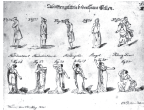
Theatralische Gestik, 1832

Das hiesige Theater trägt den Namen Deutsches Nationaltheater Weimar seit 1919; das heutige Gebäude stammt aus dem Jahr 1948. An gleichem Ort befand sich aber bereits 1779 genau das Weimarer Hoftheater, dessen Leitung Goethe später viele Jahre lang innehatte. Goethe setzte sich für eine qualitativ hochwertige Ausbildung der Schauspieler ein. Sorgfältiges Rollenstudium und diszipliniertes Verhalten der Schauspieler waren ihm besonders wichtig. Er prägte als Intendant den sogenannten »Weimarer Stil«, eine neuartige Verbindung von rhythmischer Deklamation, Körpersprache und Mimik: Denn vor allem Handeln und Sprechen zeichnen für ihn das Wirken des Künstlers aus, wie ja auch die fünfte Zeile der Gelegenheitsdichtung deutlich macht.